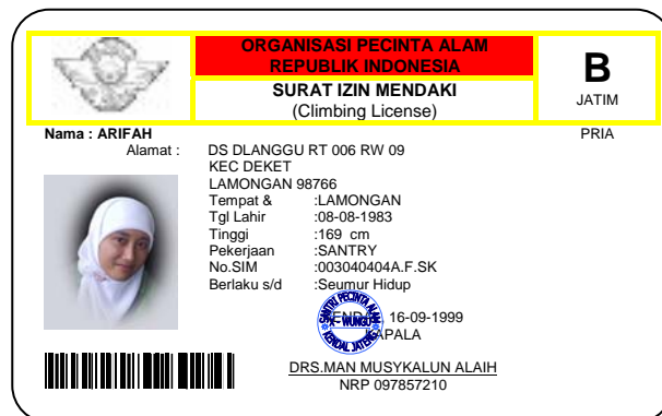
Gambar 1. Contoh ID Card